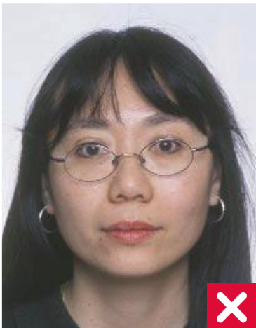
ჩარჩო ფარავს თვალებს