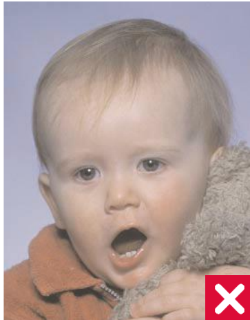
პირია ღია და სათამაშო სახესთან ახლოსაა