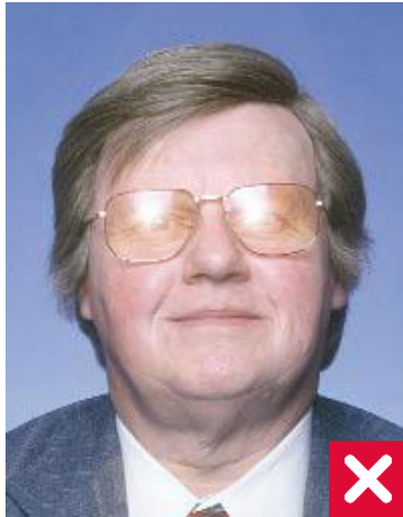
განათების არეკვლა მინებზე