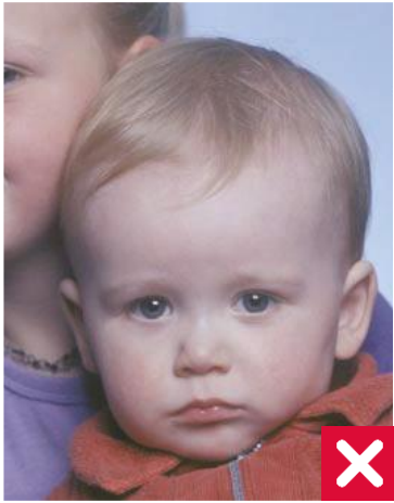
ჩანს სხვა ადამიანი