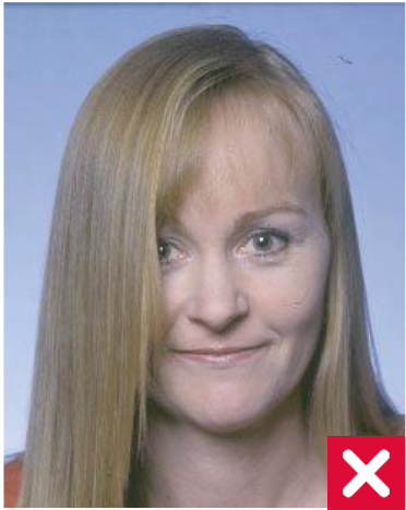
თმა ფარავს თვალს