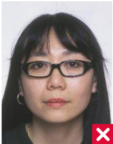
ზედმეტად მსხვილი ჩარჩო