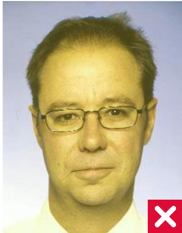
კანის არაბუნებრივი ფერი