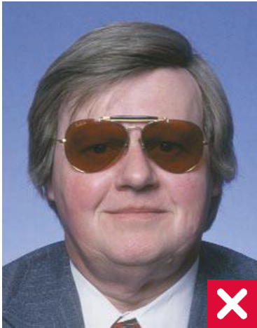
მუქი ფერის მინები