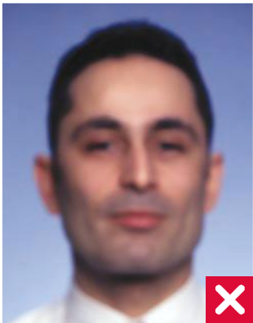
არ არის მკვეთრი